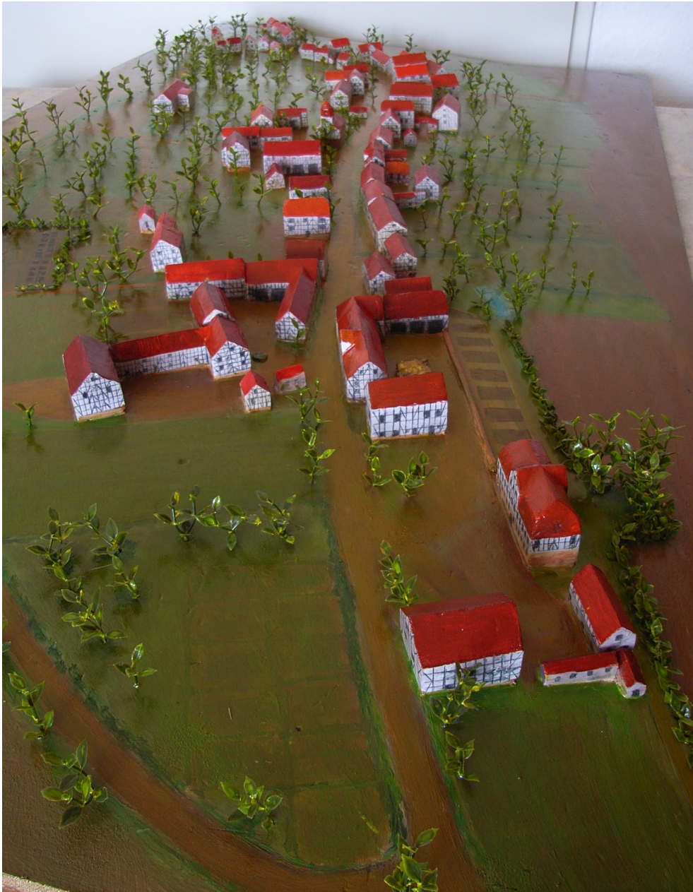
Ansicht von Südwest