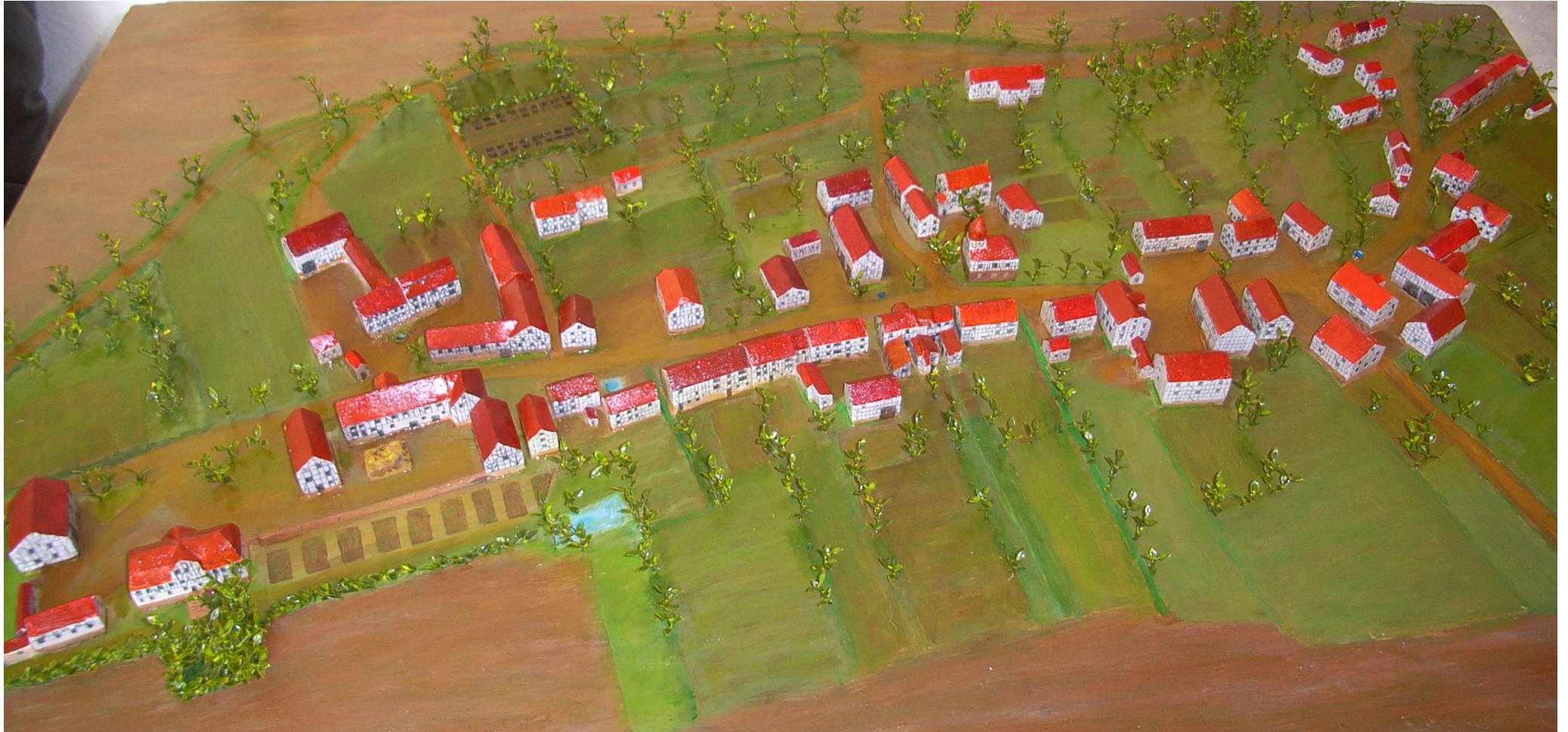
Modell im Maßstab 1:500 Günther Herwig (Erstellt 2013)