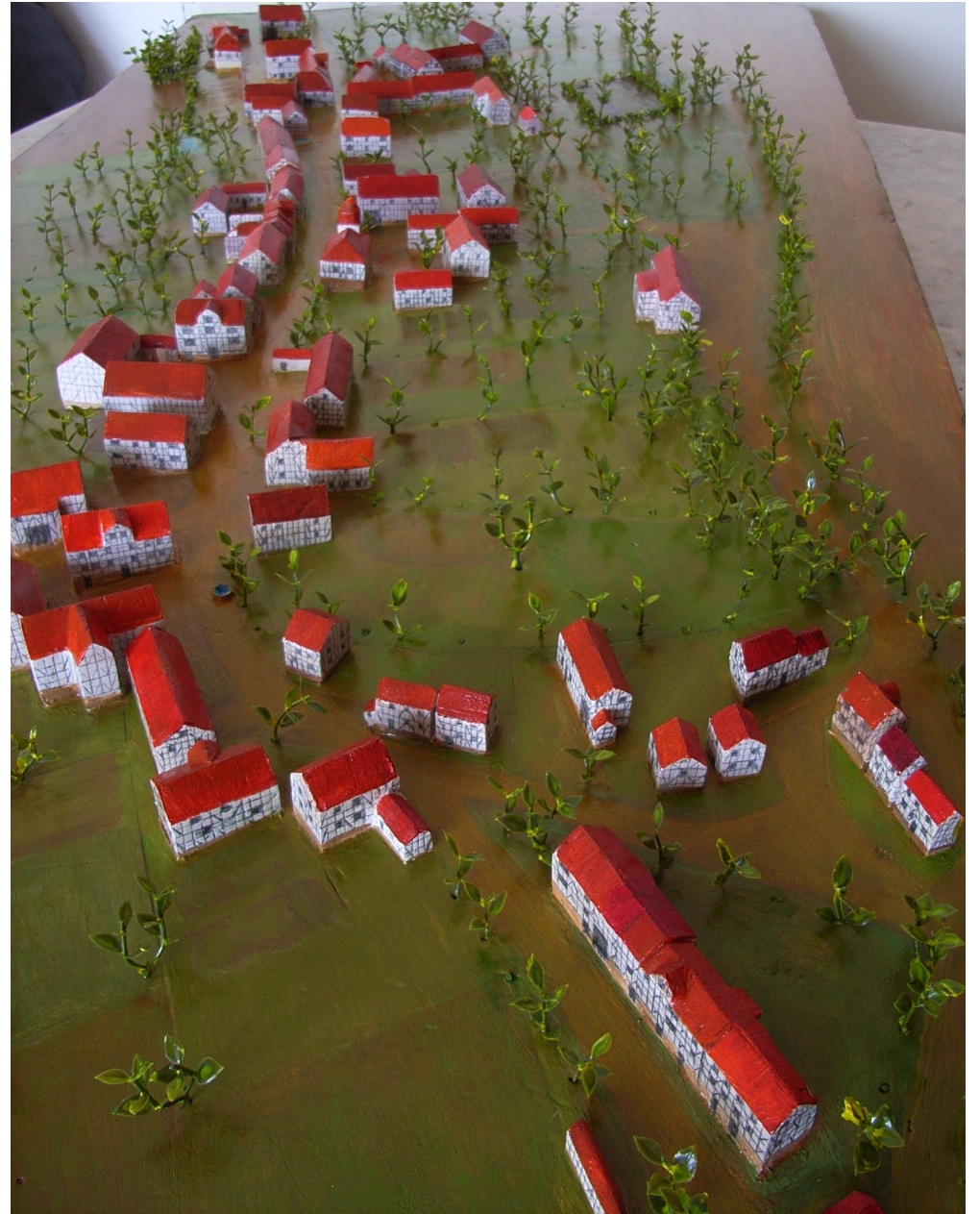
Ansicht von Nordost