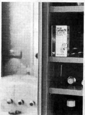
Sollte in keiner Hausapotheke fehlen: Enzym-Lefax® N.

GUTSCHEIN Senden Sie mir kostenlos die Broschüre „Magen-Darm-Probleme“ ASCTE AG, Postf. 500132 22701 Hamburg