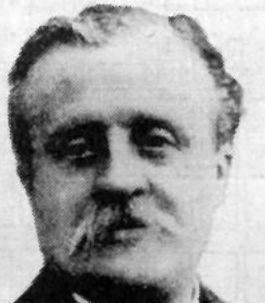
Beschrieb 1882 als erster die Krankheit: Philippe Charles Ernest Gaucher.

Kindesalter kann die Milz bis zum 20fachen ihrer normalen Größe, die Leber bis zum 5fachen anwachsen. Diese stark vergrößerten Organe füllen beinahe den gesamten Bauchraum aus und blähen ihn auf. Diese auffällige Symptomatik führt neben der körperlichen zusätzlich zu einer psychischen Belastung.