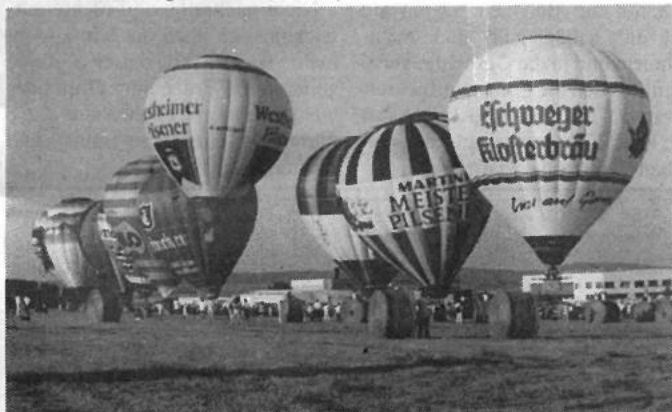
Treffen der regionalen Ballonfahrer anlässlich des Flugplatzjubiläums im vergangenen Jahr.