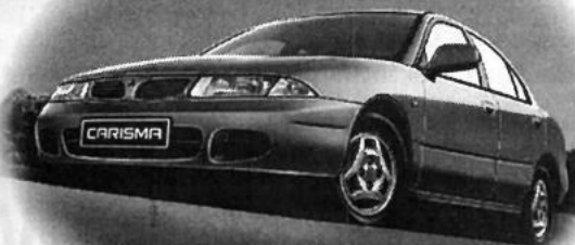
Abb.: Felgen Sonderausstattung