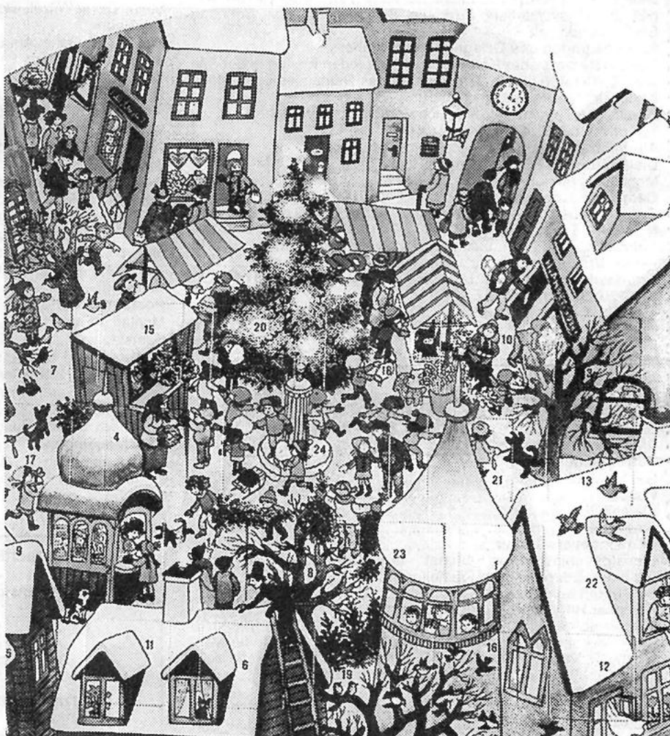
Ohne Adventskalender fiel das Warten auf Weihnachten noch einmal so schwer.