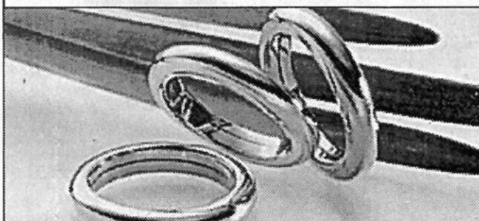
Schlichte, zeitlose Eleganz zeichnet diese Ringe aus.

Zu unterscheiden ist zwischen 333 /- (= 8 kt), 585/- (= 14 kt) und 750/ - (=18 kt). Je höher der Feingoldanteil, desto weniger Silber und andere Metalle wurden dem Rohmaterial beigemischt, um eine bestimmte Farbe oder Härte zu erzielen.