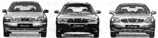
Lanos schon ab 20.500,- DM Nubira schon ab 29.990,- DM Leganza schon ab 37.490,- DM Unverbindliche Preisempfehlung des Importeurs, zzgl. Überführungskosten.

Bei diesem Angebot müssen Sie nicht zwischen Urlaub oder Neuwagen entscheiden. Wer sich jetzt bei seinem Daewoo Händler für einen Lanos, Nubira oder Leganza, mit Doppel-Airbag und Servolenkung serienmäßig, entscheidet, der kann beides haben.