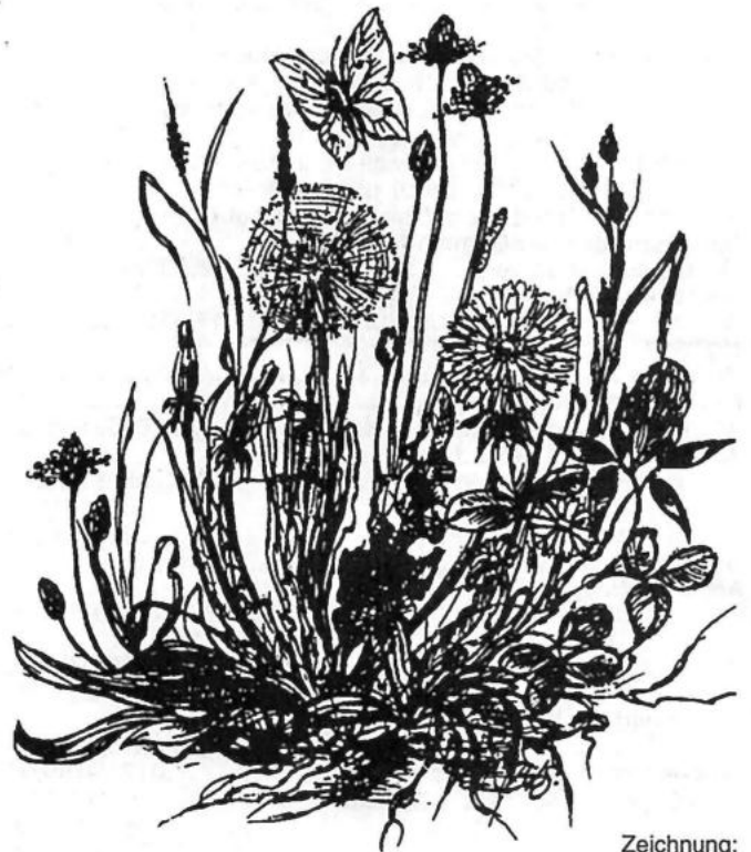
Zeichnung: Barbara Schmidtke

Bei Hitze legt' ich mich ins Gras, die Ähren freundlich nickten, es kämen Hummel, Lerche, Has, die tänzelnd mich entzückten.