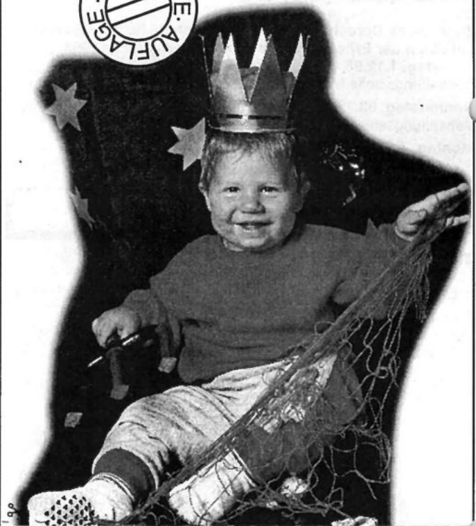
Name, Anschrift, Telefon