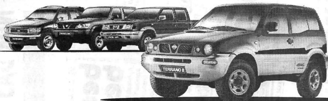
Abb. Terrano II Sport

Sie sind noch keinen Probe gefahren? Schlamm drüber.