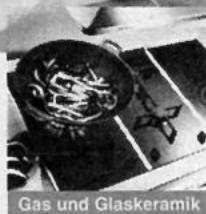
Gas und Glaskeramik

Küchen von SieMatic setzen Maßstäbe. So wie alle Küchen von Hämel. Mit hohen Ansprüchen an Ausstattung und Komfort, an Qualität und Verarbeitung. Und natürlich mit vielen innovativen und wegweisenden Ideen in Design und Technik. Da wird Küchenkauf zu einer Investition für die Zukunft - wir beraten Sie gerne!