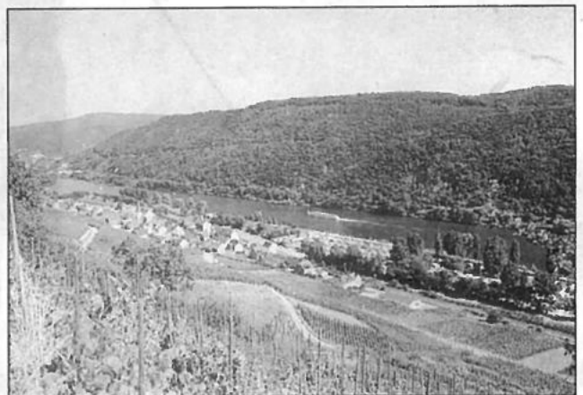
Pommern / Mosel