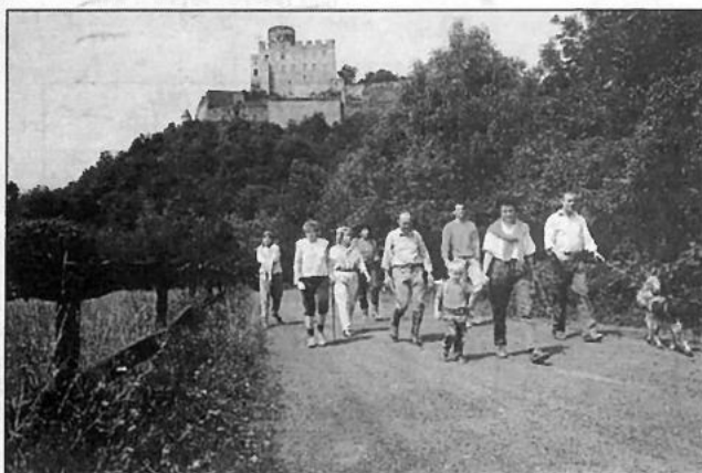
Burg Pymont mit Wandergruppe