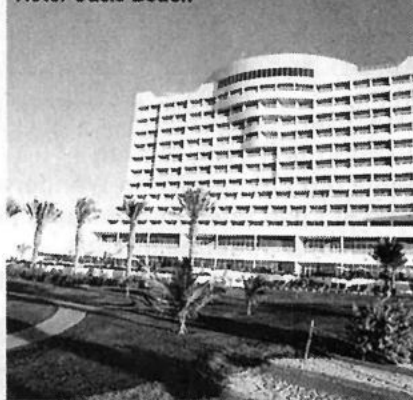
Hotel Oasis Beach

Voraussetzung für das Golf spielen in Dubai ist bei Männern ein Handicap von 28 oder weniger und bei Frauen von 36 oder weniger. Das Handicap muß auch vor Ort belegt werden.