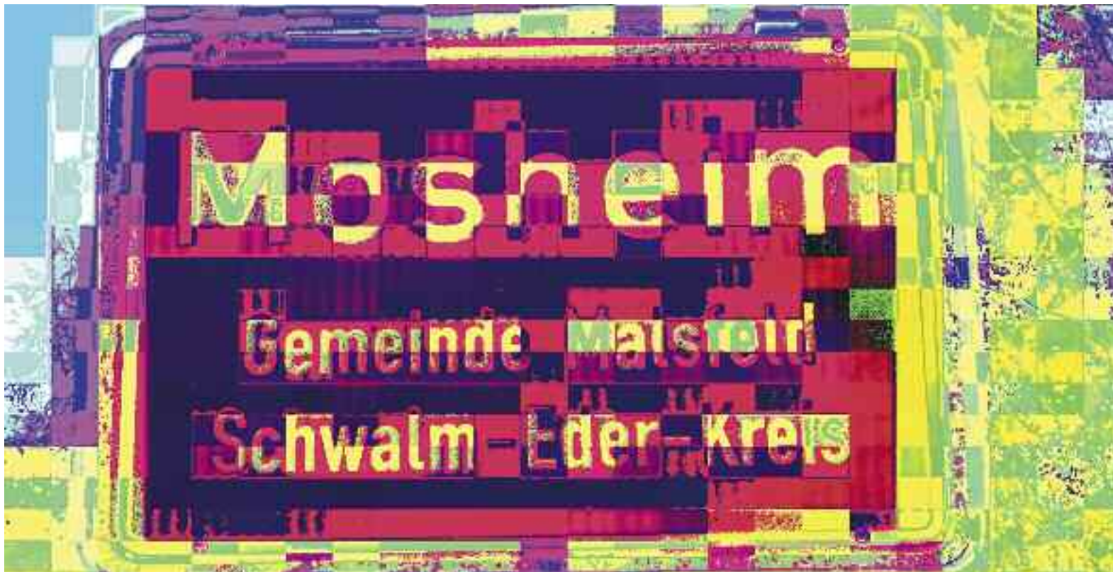
Bild linke Seite: „Kulturlandschaften“. Der Mensch kultiviert die Landschaft. Bild oben links: Kindermasken, Bild oben rechts: „Kunstkurs für Kinder im Atelier“, Bild links: „Mosheim in moderner Gestalt.“