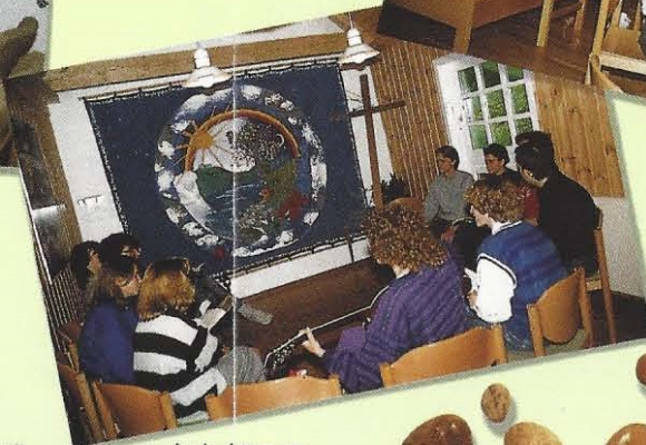
Andachtsraum: Kapelle. Kleiner Gruppenraum mit dreißig Stühlen als Andachtsraum ausgestattet.