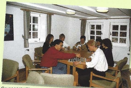
Gruppenraum: Die gute Stube mit 20 Sesseln und Tischen als Clubraum eingerichtet.

Später diente der Hof Largesberg als Bauernhof, bis der CVJM Kassel im Jahr 1982 das Anliegen erwarb und die Gebäude vollständig renovierte. Trotz der neuen großzügigen Einrichtung ist der Charakter des alten Fachwerkhauses erhalten geblieben. Seit 1988 ist das Rittergut "Hof Largesberg" als Freizeitheim fertiggestellt, und steht für Freizeiten, Seminare, Tagungen und Gruppen jeder Altersstufe zur Verfügung. Es bietet viel Platz und vielfältige Programmöglichkeiten.