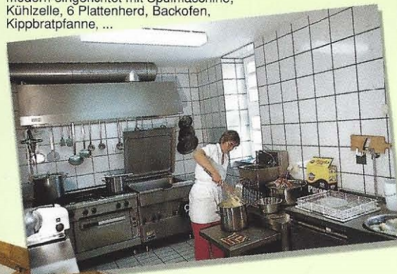
Küche: modern eingerichtet mit Spülmaschine, Kühlzelle, 6 Plattenherd, Backofen, Kippbratpfanne, ...