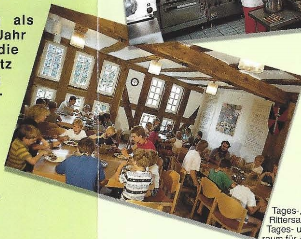
Tages-,Eßraum: Rittersaal. Großer Tages- und Speiseraum für 40-50 Personen.