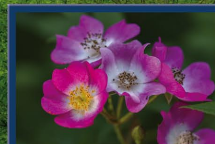
Wildrosen sind sehr vielfältig. Ihre Standortansprüche reichen von trocken bis feucht und von sonnig bis schattig. Die Farbe der oft stark duftenden Blüten reicht von weiß über rosa bis zu rot. Sie sind im Gegensatz zu denen der meisten Kulturarten ungefüllt, so dass Insekten hier Nahrung finden können. Vögel und Haselmäuse bauen ihre Nester in die stachelbewehrten Äste. Im Herbst schmücken Hagebutten die Sträucher noch lange nach dem Blattfall.