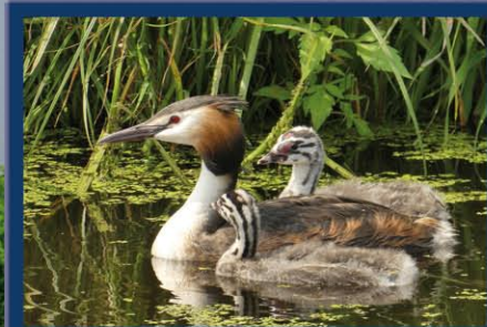
Haubentaucher leben an fischreichen, stehenden oder langsam fließenden Gewässern, wo sie im Schutz des Röhrichtsaumes zur Brutzeit schwimmende Nester bauen. Haubentaucher vollführen eine auffällige Balz, bei der sich die Vögel unter anderem durch Paddeln mit den Füßen voreinander Brust an Brust aus dem Wasser heben und Geschenke wie Nistmaterial oder Fische austauschen.