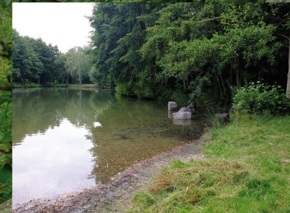
Viele der am Goldbergsee vorkommenden Arten reagieren empfindlich auf Störungen durch den Menschen. Deswegen sind aus Gründen des Naturschutzes am Goldbergsee Baden, Angeln und Spazieren am Ufer verboten. Damit die Bevölkerung den Bereich trotzdem zur Freizeitgestaltung nutzen kann, wurde ein eigener Badeteich geschaffen.