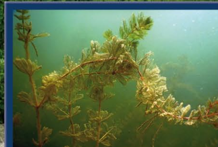
Das Ährige Tausendblatt wurzelt in 1 bis 5 m Wassertiefe und zeichnet sich durch feingefiederte, in Quirlen angeordnete Blätter aus. Lediglich die von Juni bis August erscheinenden Blütenstände ragen einige Zentimeter über die Wasseroberfläche hinaus. Die elastischen, den Bewegungen des Wassers folgenden Stängel beinhalten ein spezielles Durchlüftungsgewebe, das für Auftrieb sorgt und der Pflanze den Gasaustausch erleichtert.